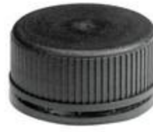
SK 41/23 PV PE