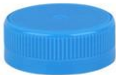
SK 38/15 SFB PE 1,1