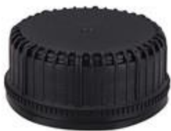
SK 42/21 SFB MK