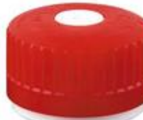
SK 38/30 PV CR PE