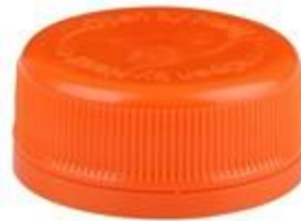
DS 35/17 SFB CSD