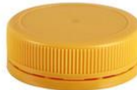
SK 48/17-3 MO 3T (3444)