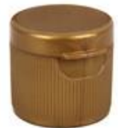
HC EV 29/32 PART LIN