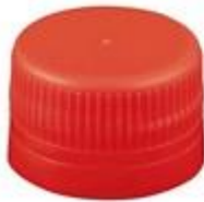
LS 28 S NR PET UNI