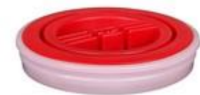
VU 69/13 / SK 60/12