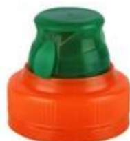
TU 38/37 3T MIB (7482)