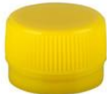
DS28 7064 HF SHORT BORESEAL 120KN UNI