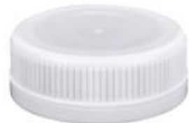
SK 38/15.5 S 3T (3400)