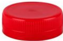
SK 38/15 S 3T MO (3419)