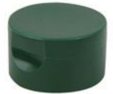
HC SK 32/30-1 RD Viv IHS PET/PVC (52 rd)