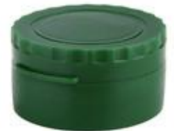
HC EV 29/17-1 MAG (4203_R)