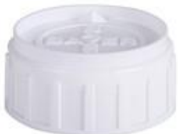
SK 50/26 CUT IHS