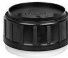
SK 50/34 SFB CUT CR EPE