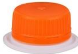
ASV 36/16MRS/SK26/13 (ELO CAP UP)