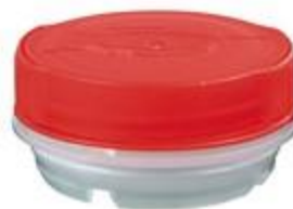
VUP/SK43/11 CR ALU PEEL