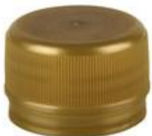
DS28 7076 ECO EW O2S-2 UNI