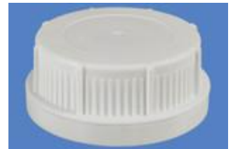
SK 60/31 MAB MDR (DIN)