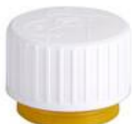
SK 28/26 SLB CR PE 25,9/2