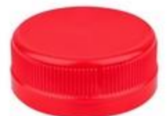
DS 38/15 2T SFB (3503)