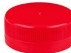
SK 38/16 S2 MK2