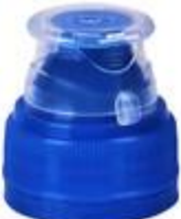
TU 28/33-2 MIB PCO 1881