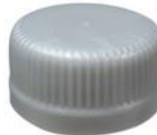
DS SUS 28/16 7088 SFB CSD4