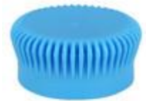
DS SUS 28/15 7100 SIB DIAMOND