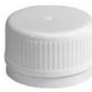
SK 31,5/21 PV PEPVDC