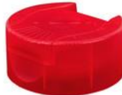
HC SK 38/25 RD Ergo Vlv (55 rd Ergo)