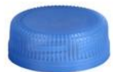
HEXALITE 26/10,5 7250 SFB 3T