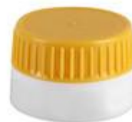
EV 21/20 MAG PART