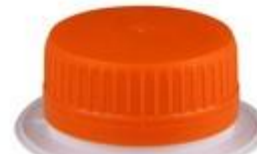
ELO CAP UT