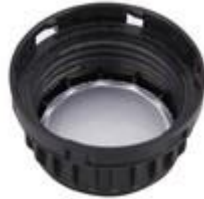
SK 37,5 /26 MAB IHS