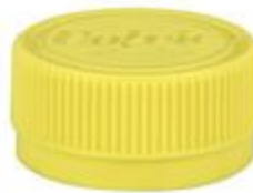
STAGNO 34/17.5 2K