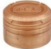
CTC H IP 29/20 MAG GL