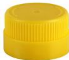
EV 32/21 MAG (7471)