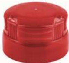
CTC IP 29/19