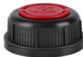
SVB 60/32 MAB