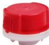
VUL/SK24/12 CR REL