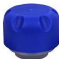
VU SK 27/35 (7413)