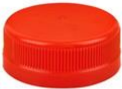
DS 38/15 2T SFB HF 2,15MM EWALL (3601)

BERICAP PERÚ - PETER HENNINGSEN S.A.C. TELF: 7178686 email: peter@phperu.com PARA VER LAS CARACTERISTICAS DE CADA TAPA POR FAVOR HACER CLICK EN CADA MODELO