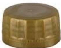
DS SUS 28/16 7077 SFB CRL