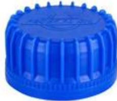
SK 40/24 SFB EPE IHS FEDERAL OIL