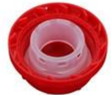
SK 45/26 MAB MDR GE 4 (DIN)