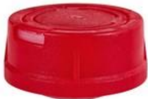
SVB 50/23 PA