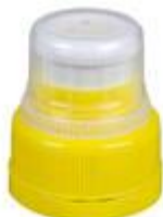
PUP NG 28/34 1881 MIB