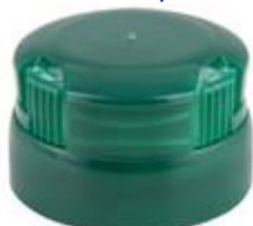
CTC IP 29/20