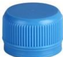
DS28 7069 STILL UNI 144 KNURL