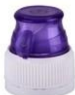
TU 30/36 3T MIB (7432)