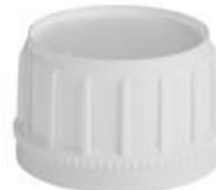
SK 45/32 SFB CUT PE PET