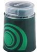
LSK EV29/44 GALILEO (7195)