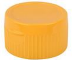
HC SK 32/30 RD MJET2 IHS PE/PP (52 rd)