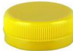
SK 38/16 S DS HF