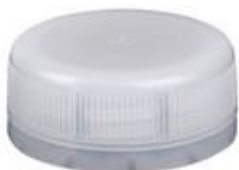
DS 33/15 SFB HF (3302)