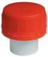
SKD 38/23 PV MDR

BERICAP PERÚ - PETER HENNINGSEN S.A.C. TELF: 7178686 email: peter@phperu.com PARA VER LAS CARACTERISTICAS DE CADA TAPA POR FAVOR HACER CLICK EN CADA MODELO