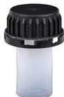
SK 37,5/26 MAB D 31/74 - 40ml