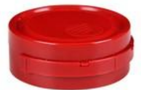
HC SK 39/18 RD 6mm TE (51 rd TE)