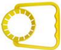
TG 84/99 4finger 48 mm (8018)