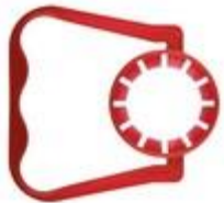
TG 42/84 (8008)