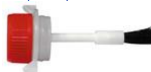
VUL/SK24 Z BR RH