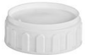
SK 63/27 CUT IHS AGRO