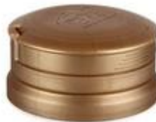
CTC H IP 36/22 MAG GL