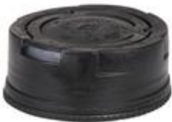
SVB 50/22 PA FB MV