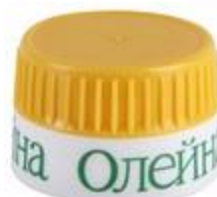
EV 21/20 MAG (7740)