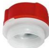
VUL/SK24/12 CR ALU