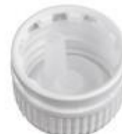
SK 25/20 PV PLUG