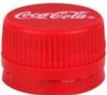
LS 28 DSP