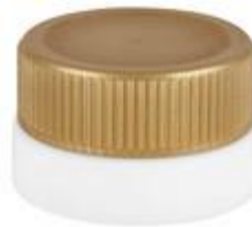
EV 36/23 MAG UNI (BC F 7017)