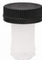
SVT 45 SK50/20 SL