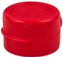
HC EV 26/18 MAG (BC F 4530)