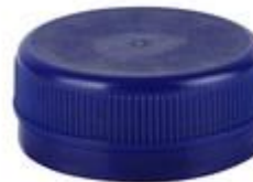
SK 38/16 S DS LC