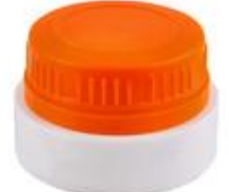
EV 51/31 MAG