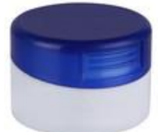
HC EV 2K 28/21 MAG (BC HU)