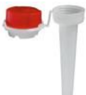
VUN/SK30/15 CR KR