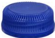
HEXALITE 29/13 7284 SFB H 3T 72KN