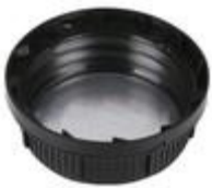
SK 60/31 MAB EPE IHS

BERICAP PERÚ - PETER HENNINGSEN S.A.C. TELF: 7178686 email: peter@phperu.com PARA VER LAS CARACTERISTICAS DE CADA TAPA POR FAVOR HACER CLICK EN CADA MODELO