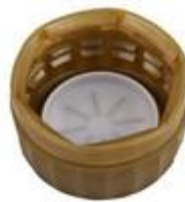
DS SUS 28/16 7077 SFB CRL O2S