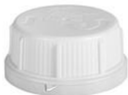
SK 45/27 MAB MDR CR