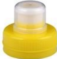
PUP NG 38/35 2T MIB