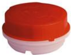
VUP/SK43/11 CR REL