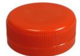
DS 38/15 2T SFB HF 1,5MM EWALL (3600)