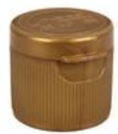
HC EV 29/32 MEM LKK LIN