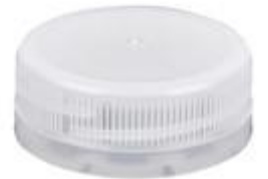
DS 38/15 2T SFB ECO (3505)