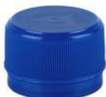
DS28 7065 ECO UNI 1331