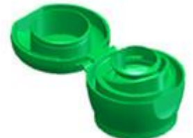
HC EV 28/27 (PCO 1881)