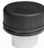
SKD 41/23 PV MDR D27/41