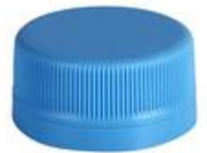
DS SUS 28/16 7094 SFB CSD STILL