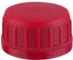
SK 38/23 SFB PE