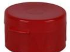
HC SK 32/21-2 RD IHS PE/PP 6 MM (35 rd)