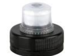
PUP 38/35 3T (7942)