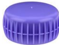
SK 40/22 NTE LW