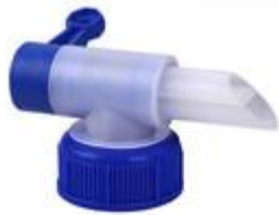
TAP BERIFLOW 45