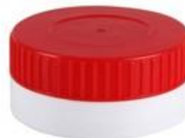
EV 48/23 MAG (7123)