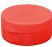
HC SK 38/18 RD Vlv IHS PT PE/PP (41 rd)