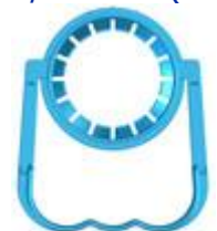
TG 86/101 - 48 mm (8006)