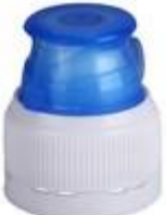
TU 28/36 MIB (7422)