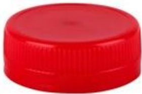
DS 38/16 2T SFB HF 1,5MM EWALL (3606)