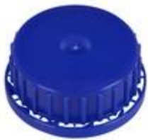
SK 42/21 RB BS