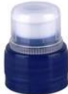
PUP NG 28/38 1810 MIB