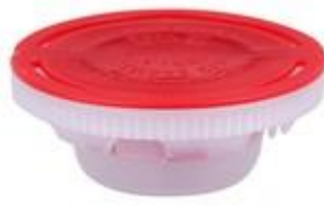
S2 REL PA MV CL