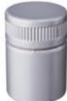
EASY FLOW ALU 47