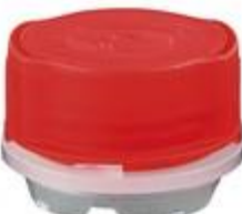
VUN/SK30/15 CR ALU