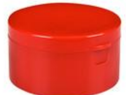
HC SK 37/31 RD Vlv (55 rd)