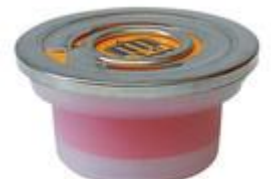
BS 42 STS