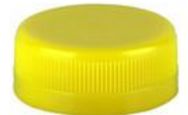
DS 38/16 2T SFB HF (3605)