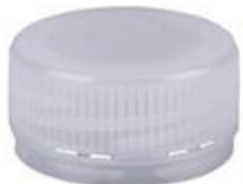
HEXACAP 30/17 3T 72 (3802)