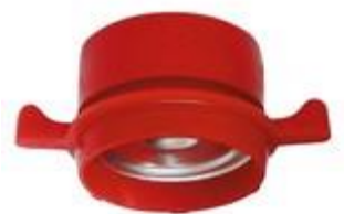
P7 PE/ALU W COVER