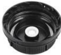
SK 55/27 MAB MDR MPV D15 (DIN)