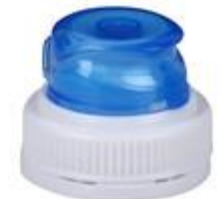
TU 29/31 3T MIB