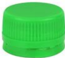
LS 28 DSP LW