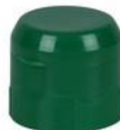
HC SK 28/26-1RD IHS PETPVC BPFPCO (30rd)