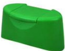
HC EV 25/25 OV Vlv (6538 oval)