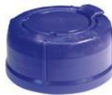
SVB 65/36 PA MDR