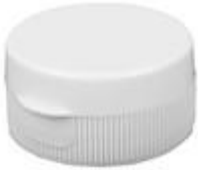
HC SK 32/18 RD Vlv IHS PE (36 rd)