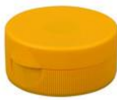
HC SK 38/18 RD Vlv (41 rd)