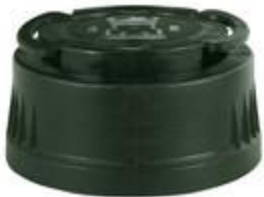
SVB 50/29 PA