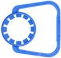
TG 84/88 38 mm neck (8017)