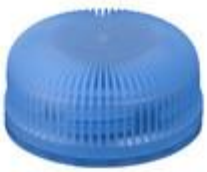
HEXALITE 26/13 7251 SFB 3T

BERICAP PERÚ - PETER HENNINGSEN S.A.C. TELF: 7178686 email: peter@phperu.com PARA VER LAS CARACTERISTICAS DE CADA TAPA POR FAVOR HACER CLICK EN CADA MODELO