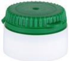
EV CTC 29/22 MAG