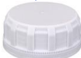
SK 63/30 SFB PE ECO