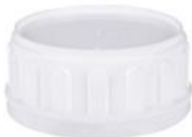
SK 63/33 SFB CUT EPE/PA