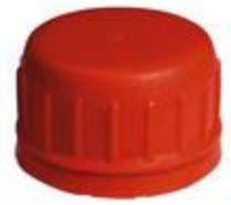
SK 32/23 PV PE