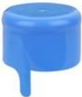
EV 55/37 NON SPILL