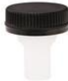
SVD 45 SK50/20 SL D-20