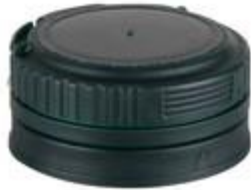
CTC IP 26/13