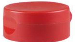
HC SK 38/25-2 RD 6mm IHS PET (55rd)