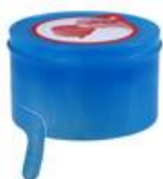
VALVELOCK 2K GASK (3508)