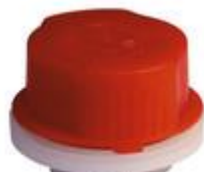
VUN/SK30/15 CR REL