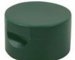
HC SK 32/30-2 RD Viv IHS PET/PVC (45 rd)