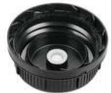
SK 60/31 MAB MDR MPV D15 (DIN)