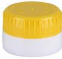
EV 26/18 MAG (BC F 7630)