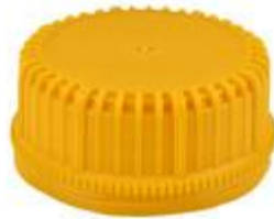
SK 42/21 SFB PE