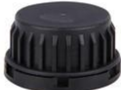
SK 37,5/26 MAB PE