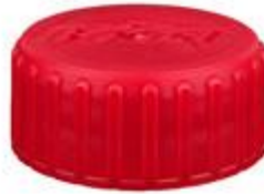
SK 38/18 2T O2S (Boost)