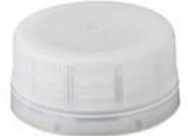
DS SUS 28/15 7103 SFB ECO