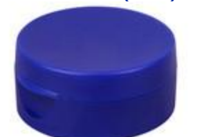
HC SK 38/25-2 RD STAR IHS PE/PP (55rd)