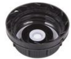
SK 45/26 MAB MDR MPV D15 (DIN)