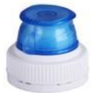
TU 29/26-3 3T MIB