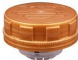
SV 45 SK50/20 S-1