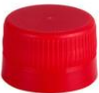
LS 28 DSP PROMO