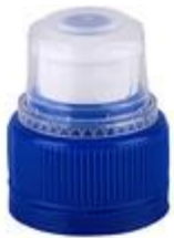
PUP 28/38 IMPROVED