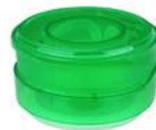
VU HC 27/25 ECO