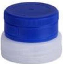
TAP 48/38 TO 1T

BERICAP PERÚ - PETER HENNINGSEN S.A.C. TELF: 7178686 email: peter@phperu.com PARA VER LAS CARACTERISTICAS DE CADA TAPA POR FAVOR HACER CLICK EN CADA MODELO