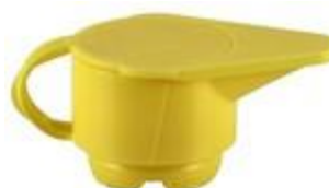
L5 KA ND GED