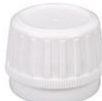
SK 28/24 SFB PE