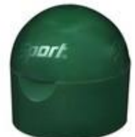
HC EV 38/39 MEM