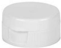
HC SK 32/17 RD 6mm IHS PE (36 rd)

BERICAP PERÚ - PETER HENNINGSEN S.A.C. TELF: 7178686 email: peter@phperu.com PARA VER LAS CARACTERISTICAS DE CADA TAPA POR FAVOR HACER CLICK EN CADA MODELO