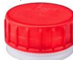
SK 38/24 SFB CR PE