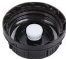
SK 55/27 MAB MDR MPV D17 (DIN)