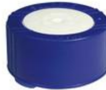
SK 38/25 PV CR PE