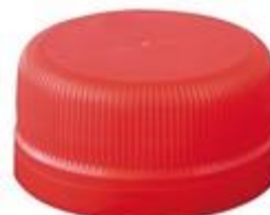
LS SUS 28/15 7092 SFB CSD