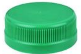
DS 38/15 2T SFB CHS (3507)