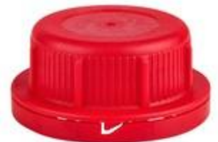
SK 45/26 MAB MDR (DIN)