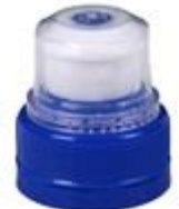
PUP 28/34 IMPROVED MIB NECK 1881