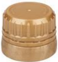
EV 32/26 MEM MIB