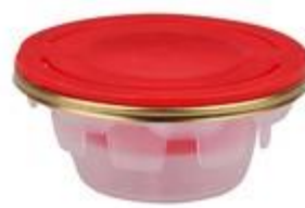
ECO SPOUT 60