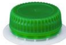
PURE - TWIST 2U