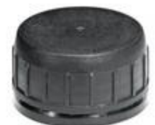
SK 38/23 PV IHS