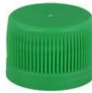
SK 25/20 PV PE