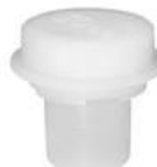
VUP D 5-30