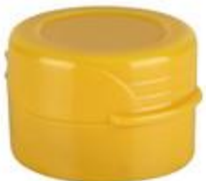
HC EV 29/21 MAG (4611)