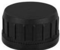
SK 38/23 SFB IHS