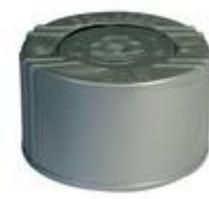
SK 32/25 PV CR PE