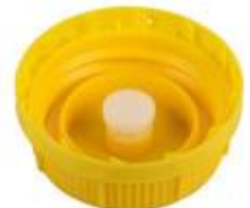
SK 60/31 MAB MDR MPV D17 (DIN)