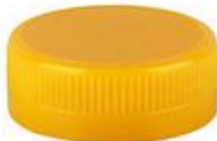
SK 38/15 SFB 3T ECO (3429)