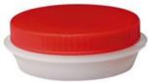
VUS / SK S3 VENT