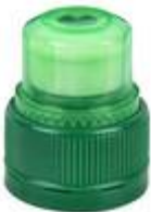
PUP 28/38 IMPROVED WHISTLE