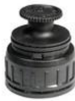
TSV 38 PV