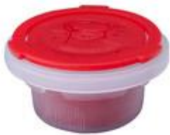
P2 REL CR CL

BERICAP PERÚ - PETER HENNINGSEN S.A.C. TELF: 7178686 email: peter@phperu.com PARA VER LAS CARACTERISTICAS DE CADA TAPA POR FAVOR HACER CLICK EN CADA MODELO