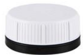
SK 60/33 MAB MDR CR (DIN)