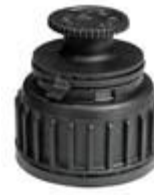
TSV 40-1 PV SHORT SPOUT