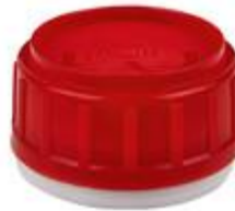
SK 50/34 SFB CUT CR IHS