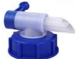
TAP BERIFLOW 55