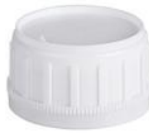
SK 50/32 SFB CUT IHS