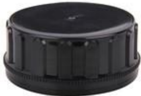
SK 63/30 SFB EPE/PET