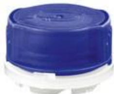
VUN/SK30/15 CR REL ALU PEEL