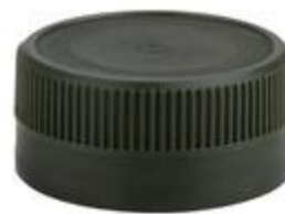
EV 42/20,5 MAG (7125)