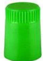
LSK EV21/44 (BC F 7831)