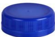
SK 38/15 SFB 3T ECO ATE (3428)