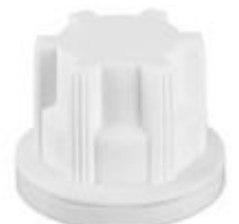
BV 21/23 MAB EPE