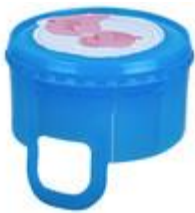
VALVELOCK 2KL NON-SPILL