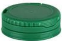
CTC 26/10 (4330)