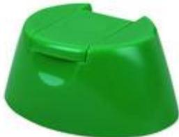
HC EV 29/25 OV CS DVlv (5540 oval)