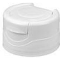
HC SK 31/20 RD Vlv (33 rd)