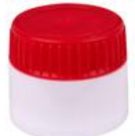
EV 28/26 MAG