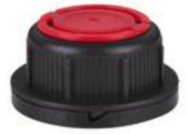
SVB 45/28 MAB MAG