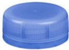
DS 33/15 SFB ACF (3303)