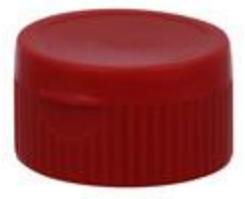
HC SK 32/30 RD 4mm IHS PE/PP (52 rd)