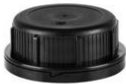
SK 55/27 MAB MDR (DIN)