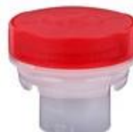
VUP SK 43/11 CR D- 20