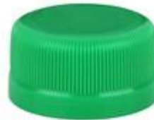
DS SUS 28/16 7084 SFB CSD2