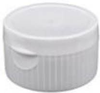
HC SK 32/30 RD VLV IHS PP (52 rd)

BERICAP PERÚ - PETER HENNINGSEN S.A.C. TELF: 7178686 email: peter@phperu.com PARA VER LAS CARACTERISTICAS DE CADA TAPA POR FAVOR HACER CLICK EN CADA MODELO