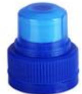
PUP 30/25 3T (7899)