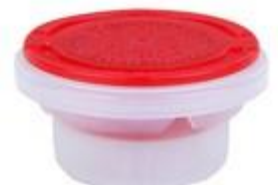
P2 REL CL