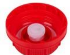
SK 45/26 MAB MDR MPV D17 (DIN)