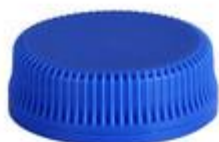
HEXALITE 29/11 7264 SFB 3T 72KN