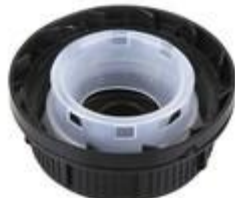
SK 55/27 MAB MDR GE1 (DIN)