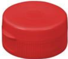
HC SK 32/18 RD 13mm IHS PET/PVC (36 rd)