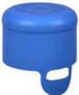
EV 55/37 NON SPILL PULL RING