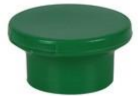
HC SK 33/25 RD trpt STAR IHS (4246)