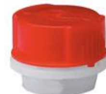
VUN/SK 24/12 CR-3 AF