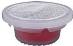
P2 REL CL ALU