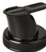
TRANSATLANTIQUE- 2 IHS (4356)