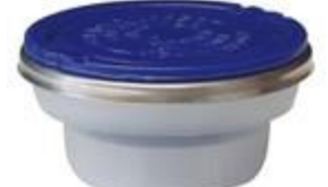
BERG SPOUT 42/3,4