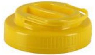
SK 110/37 MIB